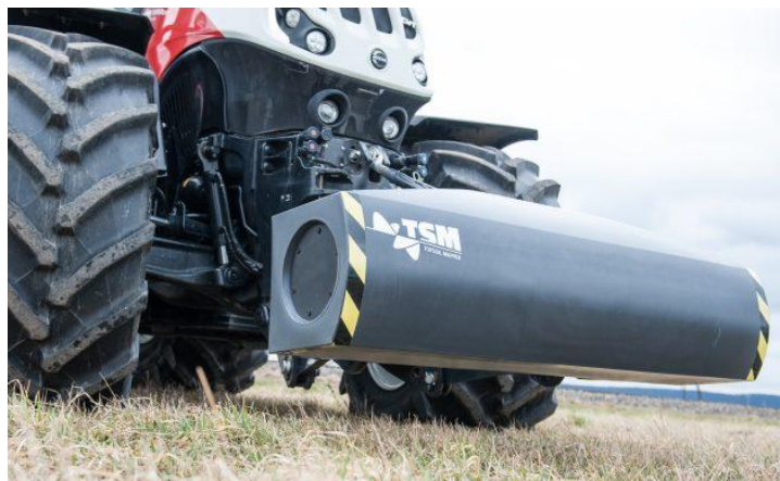
Slika 1.9. Top Soil Mapper senzor na prednjem podiznom uređaju traktora

Varijabilna obrada zemljišta može biti sprovedena i u operaciji predsetvene (plitke) pripreme. Na mnogim parcelama zemljišta nisu homogena po površini i po dubini, kao što nije ni uticaj gaženja poljoprivredne mehanizacije niti distribucija zemljišnih agregata, grudvi koje su nastale osnovnom obradom. Zbog toga postoji objektivna mogućnost da se